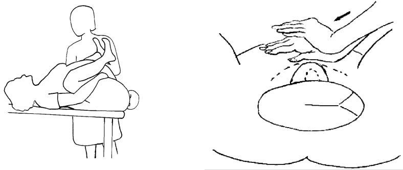
Слика 1. McRoberts-ов маневар

Употребата на McRoberts маневар наспроти литотомната позиција (Слика 1) пред клиничка дијагноза за рамена дистокија не ја намалува тракционата сила на феталната глава за време на вагинално породување кај повеќеротки. Затоа не се препорачува рутинска употреба за превенција од рамена дистокија. (Ннд-1b).